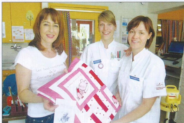
Livraison de couettes à l'Hôpital de Sion.

Tous les bébés qui naissent prématurément à l'hôpital de Sion reçoivent une Couette du Cœur. En 2011, 92 petites couvertures ont été apportées en néonatalogie. Concernant les livraisons au CHUV, lorsque suffisamment de couettes sont disponibles, les couturières prennent rendez-vous avec l'infirmière responsable. En 2011, 191 prématurés ont reçu une étoffe de couleurs qui est venue les envelopper de douceur.